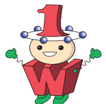
近畿大学原子力研究所の マスコットキャラクター 1Wワットくん